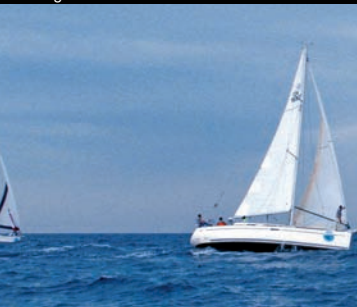
Targa Florio de la mer

pâte feuilletée frite, remplie de ricotta sucrée et aromatisée. Les fêtes et conférences sont organisées par l'Administration locale et comportent une programmation annuelle.