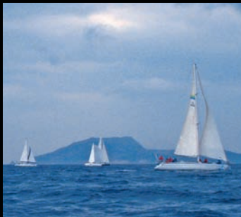
Trophée Challenge Ignazio Florio