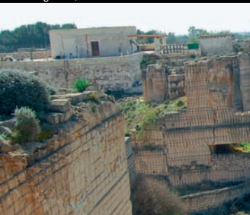
Favignana, Carrière de tuf

été taillé en blocs, le matériel était exporté en Sicile et en Tunisie. Aujourd'hui le spectacle paysager des zones extractives est vraiment très suggestif. La végétation installée dans les carrières et la lumière chatoyante du soleil confèrent à l'ensemble une couleur toujours différente, dans un spectacle qui change selon l'heure de la journée.