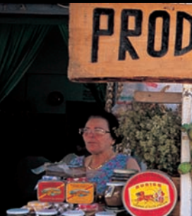
Produits de tonnara

on peut déguster partout du poisson frais, souvent agrémenté de plantes aromatiques recueillis dans les hautes plaines environnantes (menthe, thym, romarin). Les pâtes aux oursins sont une spécialité: spaghettis agrémentés d'œufs d'oursins à l'intense saveur marine.